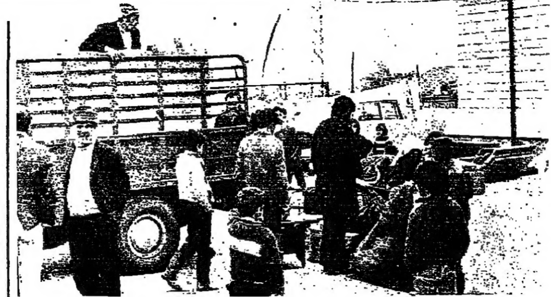
بعض التارحين ينقلون امتعتهم من حرسه مرجعيون الى اماكن جديدة عند بعض الاقارب

سقفة دائرة شرطة بيروت في البرج «بيلك» على رؤوس الموظفين في معظم مكاتبهم ، ويكاد يلف بعض الاوراق والكتبات دون ان يقدم احدا على اصلاحه . والجدير بالذكر ان مقر الدائرة مؤجر الى وزارة الداخلية من السيد هنري غرورن ببلغ رزقي مقداره ليرة ذهبية واحدة . وتقول الجار ينس على ان مثل هذا المثل اذا حصل في البناء هو على نفة الحجر ، الامر الذي اوقع المسؤولين في حيرة من امر اصلاح السقف القرميدي للدائرة الذي يكلف جلفا كبيرا .